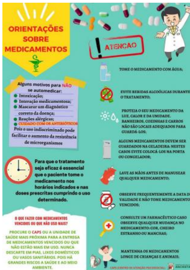
Foto 6 Orientações sobre medicamentos