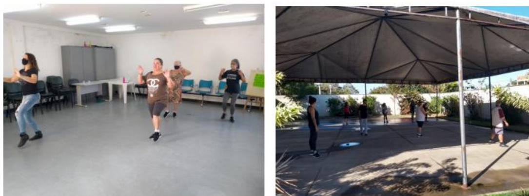
Foto 3 Corporalmente