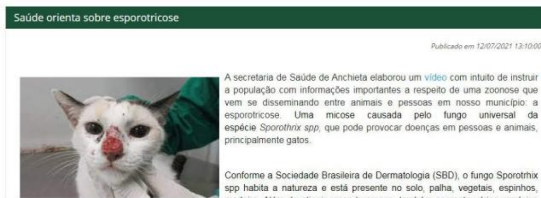
Foto 5 Orientações sobre a esporotricose