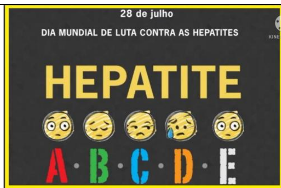
Foto 8 - vídeo infantil sobre julho amarelo