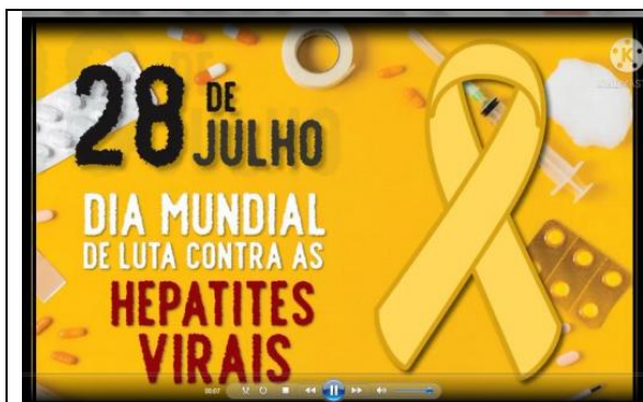
Foto 7 - vídeo sobre julho amarelo