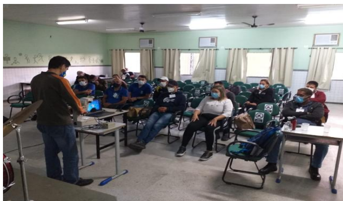
Foto 2 Capacitação de captura de vetores em Guaçuí.