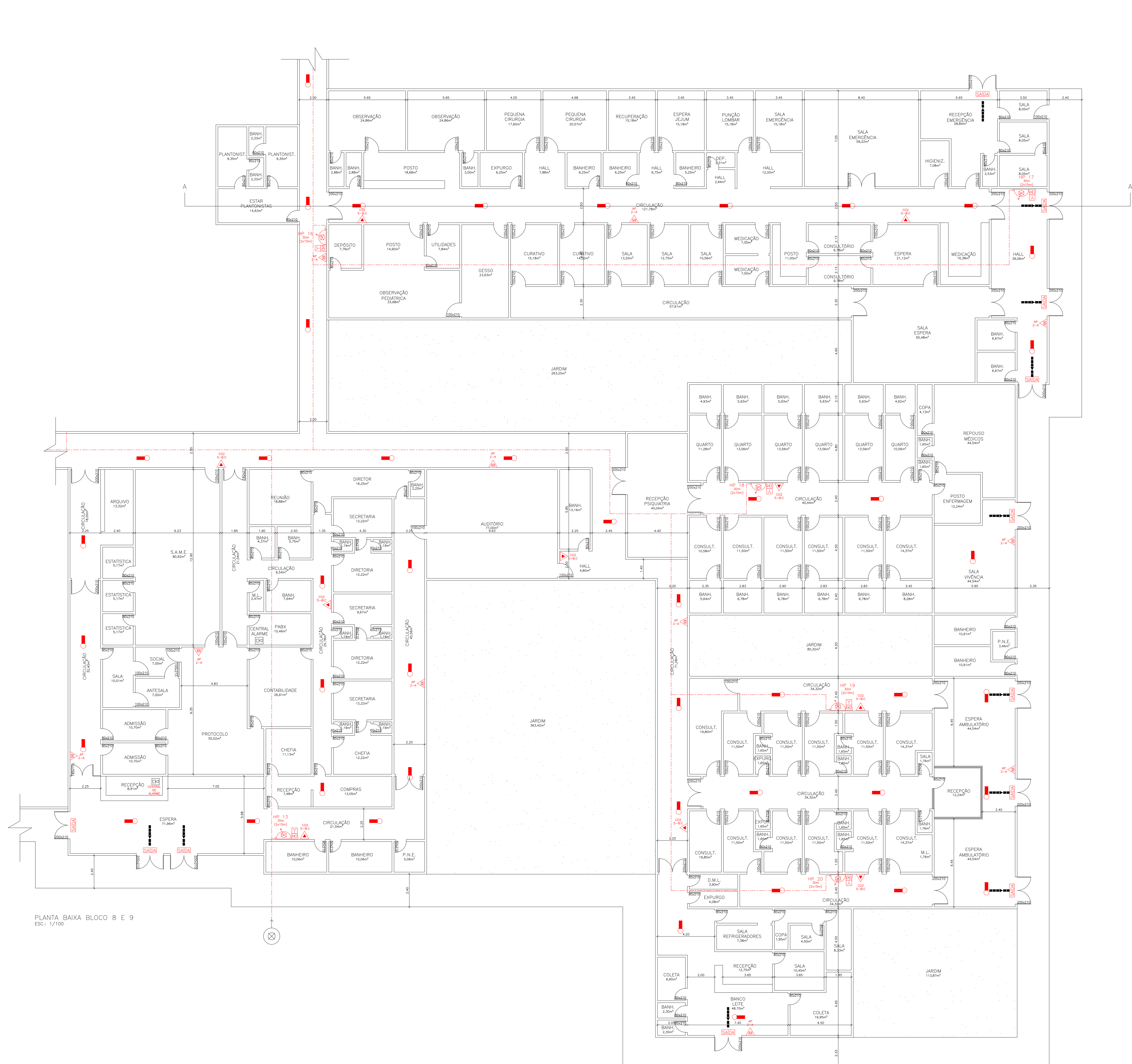
PLANTA BAIXA BLOCO 8 E 9 ESC.: 1/100