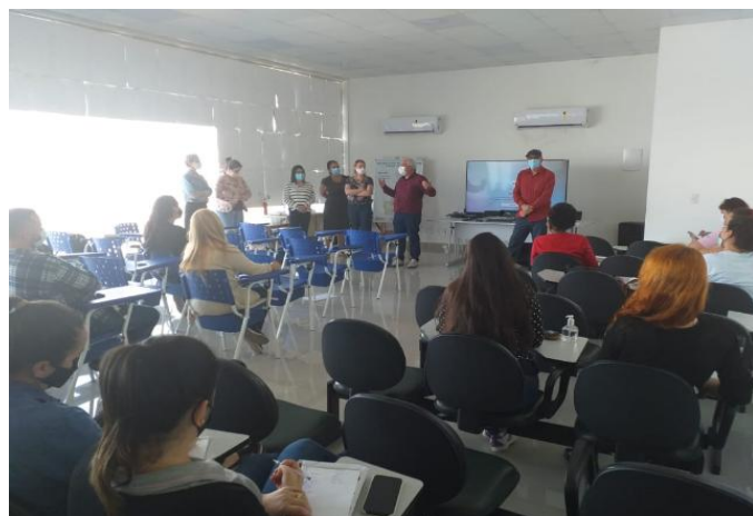
Foto 1 Capacitação de captura de vetores em Cachoeiro de Itapemirim.

Em junho também, foi dado prosseguimento no ciclo de capacitações de captura de vetores, promovido pelo Núcleo de Entomologia e Malacologia do estado do Espírito Santo (Nemes). Entre os dias 05 e 09, a capacitação foi realizada no município de Cachoeiro de Itapemirim, sendo capacitados os representantes dos seguintes municípios presentes: Cachoeiro de Itapemirim, Muqui, Castelo, Mimoso do Sul, Atílio Vivácqua, Vargem Alta e Alegre. E entre os dias 19 a 23 do mesmo mês, em Guaçuí, sendo capacitados representantes dos municípios: Guaçuí, Dolores do Rio Preto, Ibitirama, Irupi e Apiacá.