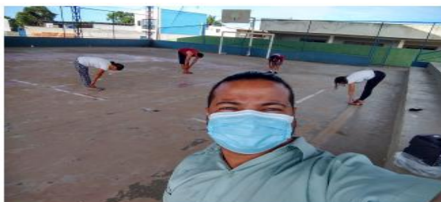
Figura5 Grupo terapêutico “Corporalmente”