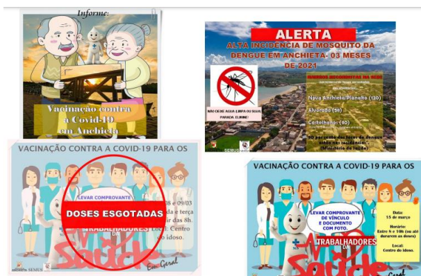
Figura 3 Banner digital

(Figura 5), trabalhando concentração, trabalho em parceria, equilíbrio, interação social e prevenindo e combatendo ansiedade e depressão, etc, no Caps 3) Ação em parceria com a rádio Sim FM, no Programa Jornal da Manhã, no quadro “Momento Saúde”, todas as entrevistas concedidas foram por áudio de whatsapp devido o isolamento, foram abordadas as seguintes temáticas: a) “Atendimento da Saúde Bucal na pandemia” b) “ O aumento de larvas do Aedes aegypti ” c) “Bairros recordistas em infestação do Aedes aegypti em Anchieta” d) Covid-19 e combate ao mosquito Aedes e) “Dia internacional da Síndrome de Down”