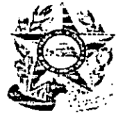
TABELA - I