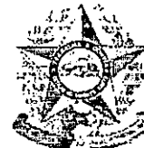
TABELA - I