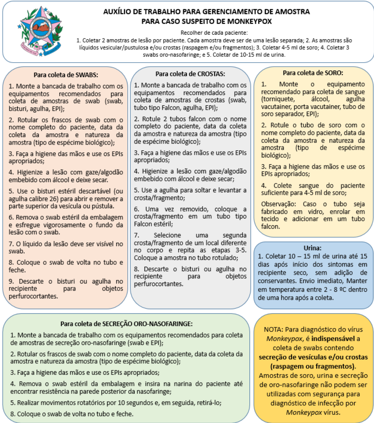
Figura 1 - Auxílio de trabalho para gerenciamento de amostra para caso suspeito de Monkeypox