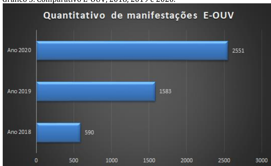
Gráfico 3. Comparativo E-OUV, 2018, 2019 e 2020.