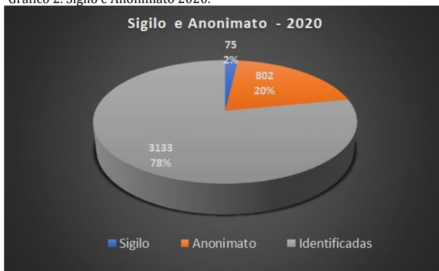
Gráfico 2. Sigilo e Anonimato 2020.