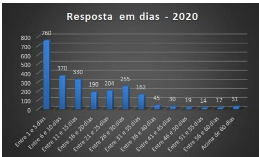
Gráfico 4. Tempo de resposta, 2020.