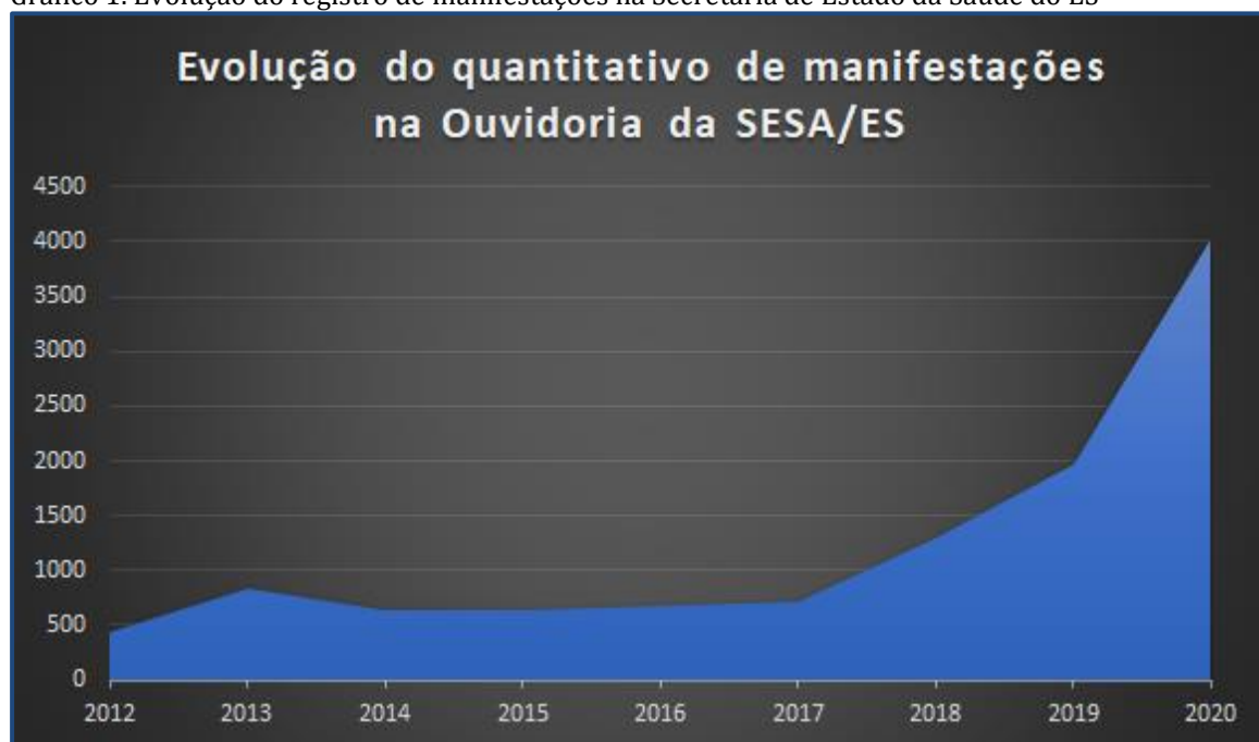
Gráfico 1. Evolução do registro de manifestações na Secretaria de Estado da Saúde do ES