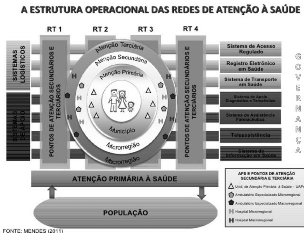
Figura 1 – Estrutura Operacional das Redes de Atenção à Saúde.

institucionais em que se prestam serviços comuns a todos os pontos de atenção à saúde, nos campos do apoio diagnóstico e terapêutico, da assistência farmacêutica e dos sistemas de informação em saúde.