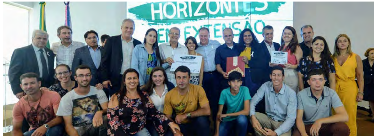
>>> O governador Renato Casagrande e a vice-governadora Jaqueline Moraes participaram da entrega das homenagens aos responsáveis por experiências de relevância para o desenvolvimento rural capixaba

O Projeto HorizontES em Extensão foi elaborado pelo Instituto Capixaba de Pesquisa, Assistência Técnica e Extensão Rural (Incaper), com o objetivo de mostrar 11 experiências de relevância para o desenvolvimento rural capixaba. O Incaper organizou a formação de uma comitiva com representantes de